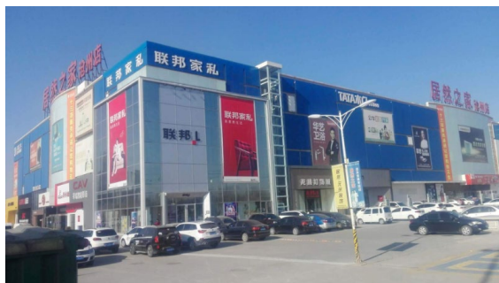
居然之家のリアル店舗のひとつ。内装関係の店舗ばかりのショッピングモールといった雰囲気

またデパート、スーパー、レストラン、レジャー・娯楽施設などのリアル店舗でも双11のセールが行われた。なかでも内装用建材等を扱う専門店の居然之家(Easyhome)では、13時9分の時点で全国266店舗の売上額の合計が100億元(約1633億円)を越えた。成都の店舗ではまだ夜も明けないうちから開店を待つ列ができたという。