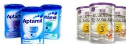
Aptamil(ドイツ)と a2(ニュージーランド)の粉ミルク