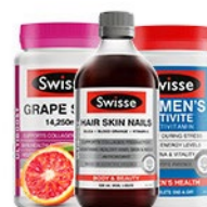
Swisse(オーストラリア)のサプリメント