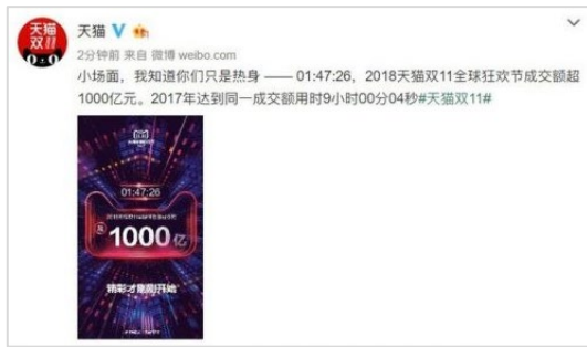
天猫の微博(Weibo)アカウントでは、売上 1,000 億元突破を知らせるメッセージが。

売上記録である 191 億元を上回った。その後も 26 分 3 秒で 500 億元を突破し、2017 年の双 11 では 9 時間かかった 1,000 億元の壁を 1 時 47 分 26 秒に越え、8 時 8 分 52 秒には 2016 年の売上記録と同じ 1207 億元を突破した。ピーク時には 1 秒間に 49.1 万件の注文があったという。