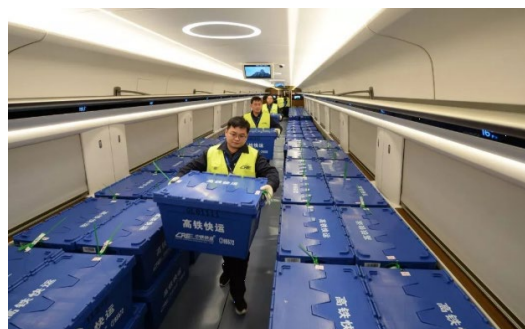
高鉄に積載される双 11 の荷物が入ったコンテナ

配達のパークは 13~17 日で、13 日は 2.5 億個、15 日は 2.85 億個の荷物が全国の購入者の元に届けられた。21 日 20 時時点の配達済み荷物数は 18.3 億個で、全体の 97%以上の配達が進んでいる。荷物 1 億個の配達にかかる時間は、2013 年に 9 日だったが今では 2.6 日にまで短縮された。