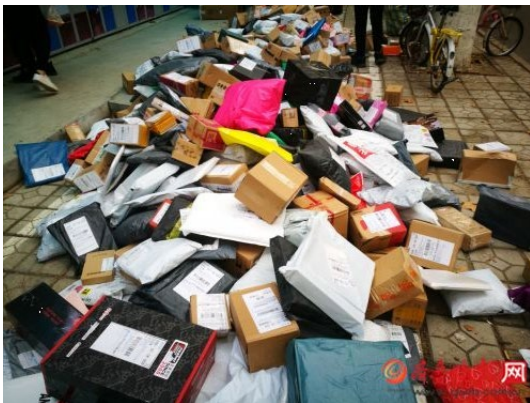
済南市にある大学キャンパスは荷物の山 http://www.qlwb.com.cn/2018/1113/1365810.shtml

同様に山東省郵政管理局によると、山東省の 11 日当日の荷物取扱数は 2,455 万個で、前年に比べて 35%増加した。このうち集荷した荷物が 1,645 万件、配達した荷物が 810 万件で、集荷数が最も多かったのは済南市の 338 万件、配達数が最も多かったのは青島市の 129 万件、済南市の 100 万件超だった。