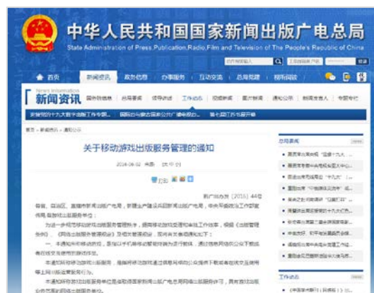
「モバイルゲームの出版に関する通知」

同通知の目的は、ゲーム会社や作者の著作権を保護し、利用者を悪質なコンピュータウイルスから守ることにある。施行後は全てのモバイルゲームで版号の取得が必須となり、その申請はパブリッシャーが行わなければならないが、手続きは無料だ。版号がないゲームはプラットフォームから削除される可能性が高く、国家新聞出版广电总局のブラックリストに入ることも懸念される。事実、同通知の施行後には、360 手机助手、百度助手、豌豆莢といった Android のアプリストアから版号のないゲームが次々に削除されている。なお、同通知の施行前にリリースされたモバイルゲームは、2016 年 10 月 1 日までに版号の取得をしなければならない。